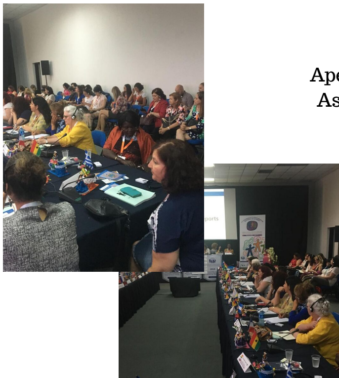
Apertura del segundo dia de la Asamblea Mundial de OMEP

Reunion por Regiones, cada region tuvo una reunion de 30 minutos, compartieron experiencias y eventos de sus países, luego cada región presento un informe lo conversado