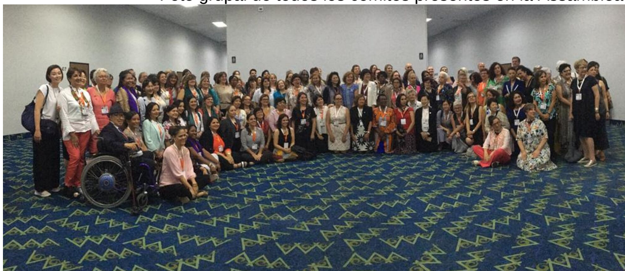
Foto grupal de todos los comites presentes en la Assamblea